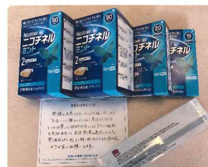
送られてきたニコチンガム210個と検査キット