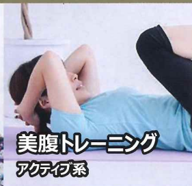
美腹トレーニング アクティブ系