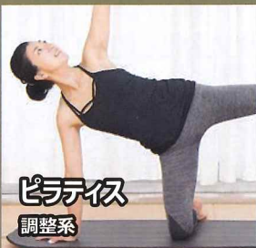
ピラティス 調整系