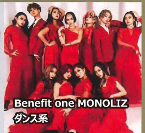
Benefit one MONOLIZ ダンス系

コナミスポーツクラブのオンラインフィットネスを充分にお楽しみいただけるように、週100本以上の「ライブレッスン」とご自分の時間やペースでみられる「オンデマンド動画」をご用意しました。